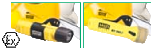
Lampade per vigili del fuoco a sicurezza intrinseca T2 e T4

Sugli elmetti serie F1 possono essere montate maschere con appositi adattatori o con bardatura standard