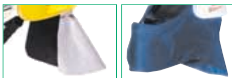
Protezione nucale in lana – Nomex, o alluminizzata