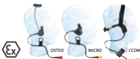
Sistemi di Comunicazione

Su richiesta per gli elmetti serie F1 possono essere impiegati diversi tipi di accessori